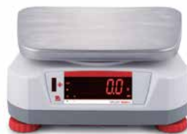
Afficheur arrière avec capteur sans contact intégré

Les deux afficheurs permettent aussi un pesage rapide et aisé dans les applications du commerce de détail. Grâce aux grands afficheurs avant et arrière de la balance Valor 4000, celle-ci peut être utilisée dans le commerce de détail où le client doit pouvoir lire le poids sur la plateforme.